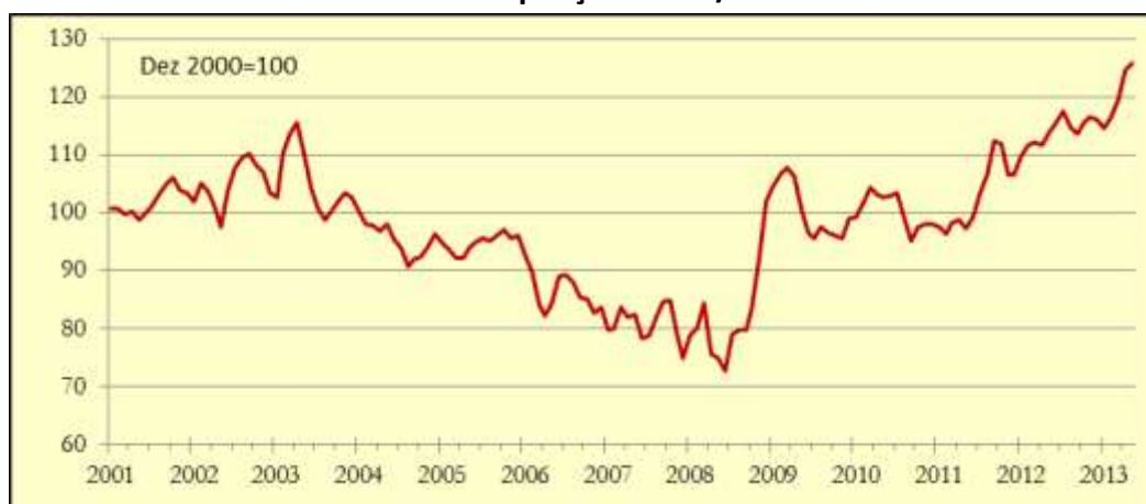
Gráfico 1: Indicador de Poupança APFIPP/Universidade Católica