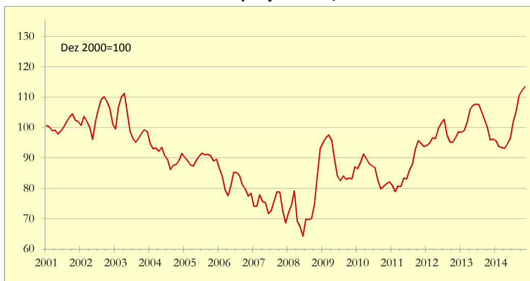
Gráfico 1: Indicador de Poupança APFIPP/Universidade Católica