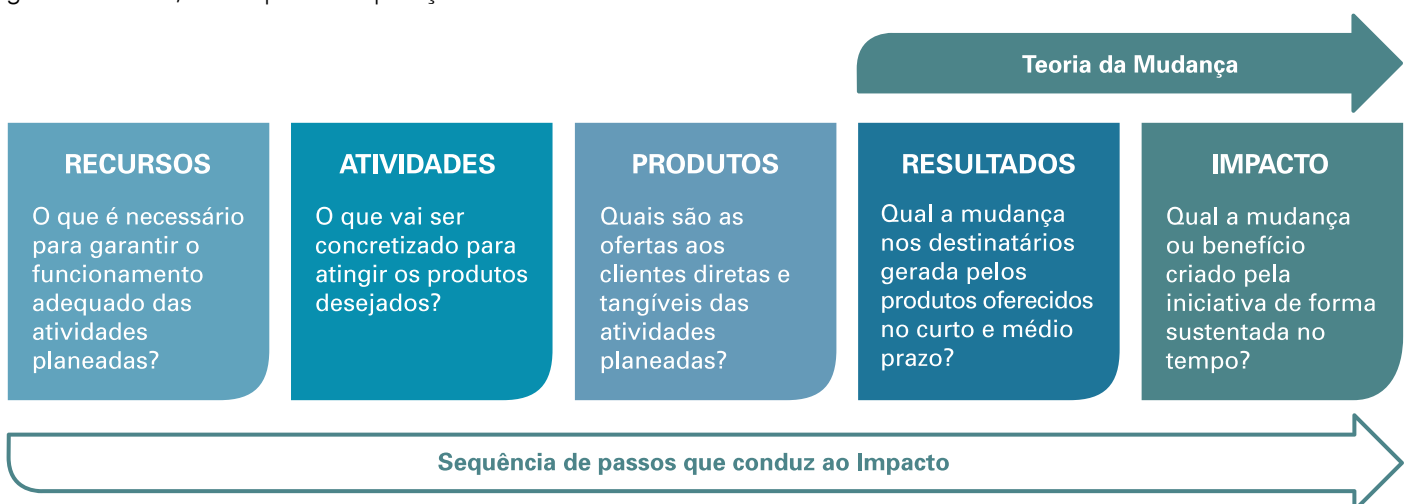
Figura 2: Modelo Lógico

Modelo Lógico (Logical Model): sequência de passos concetuais que explicam como uma organização de missão social consegue obter impacto. O modelo lógico vai dos recursos (materiais, humanos, financeiros, conhecimento) que são utilizados em atividades (as ações concretas que se realizam) que levam a produtos (os bens ou serviços fornecidos aos clientes e/ou beneficiários) que têm resultados (mudanças alcançadas com a atuação da organização) que levam ao impacto (alteração significativa e sustentável na situação da sociedade). O modelo lógico permite assim explicar como uma organização alcança impacto e como este pode ser medido e monitorizado tanto para melhorias de gestão interna, como para comparação entre investimentos sociais.